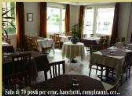
Sala di 70 posti per cene, banchetti, compleanni, ecc...