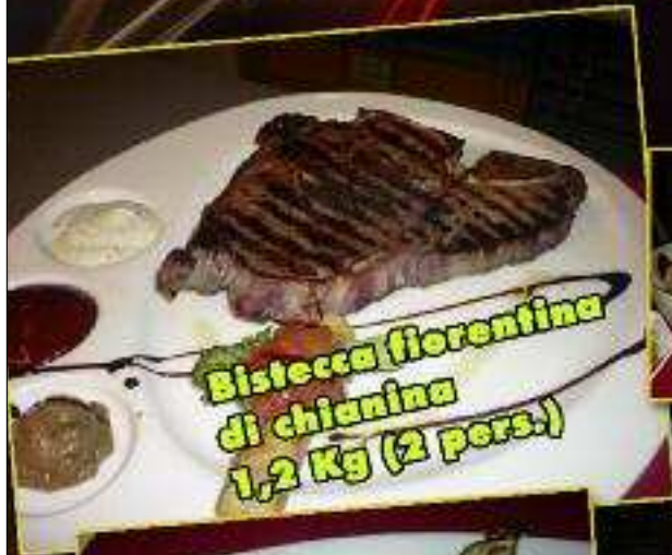
Bistecca fiorentina di chianina 1,2 Kg (2 pers.)